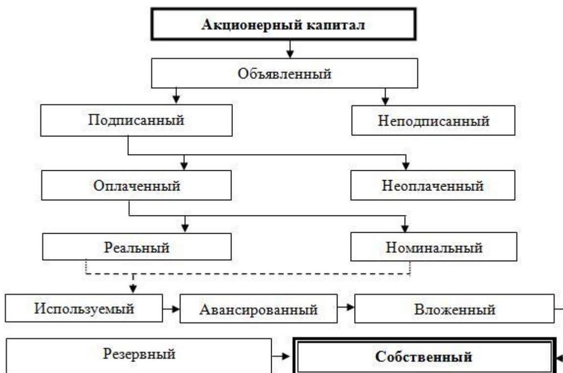
Рисунок 1.4 – Структура собственного капитала АО

Собственный капитал является абстрактной стоимостью имущества, принадлежащего владельцам акционерного общества. Сумма собственного капитала, отраженная в балансе, зависит от оценки активов и обязательств. Как правило, совокупная сумма собственного капитала только случайно соответствует совокупной рыночной стоимости акций компании или сумме, которую можно получить путем продажи чистых активов частями или акционерного общества в целом на основе принципа непрерывности.