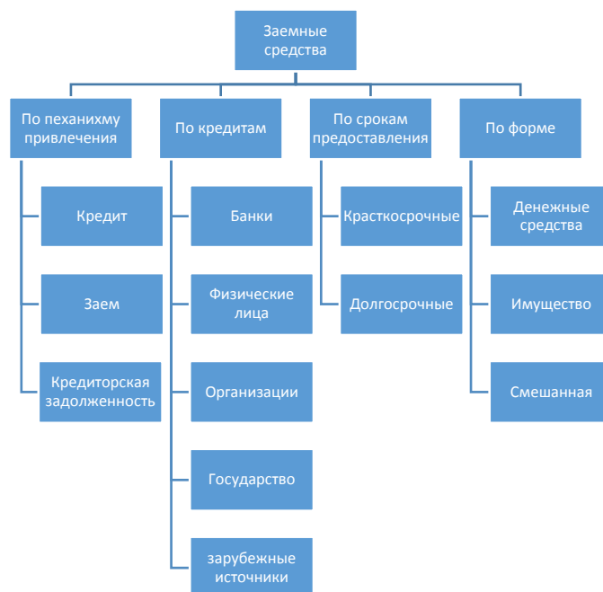
Рисунок 1.3 – Классификация заемных источников финансирования организации