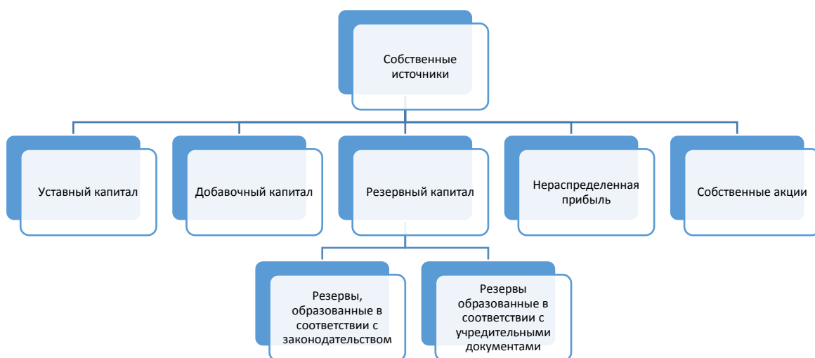
Рисунок 1.2 – Классификация собственных источников финансирования организации

По степени принадлежности используемый капитал подразделяется на собственный (раздел 3 баланса) и заемный (разделы 4 и 5 баланса). Классификация собственного и заемного капитала приведены на схемах.